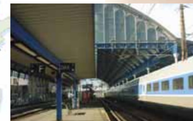
La gare de Dax